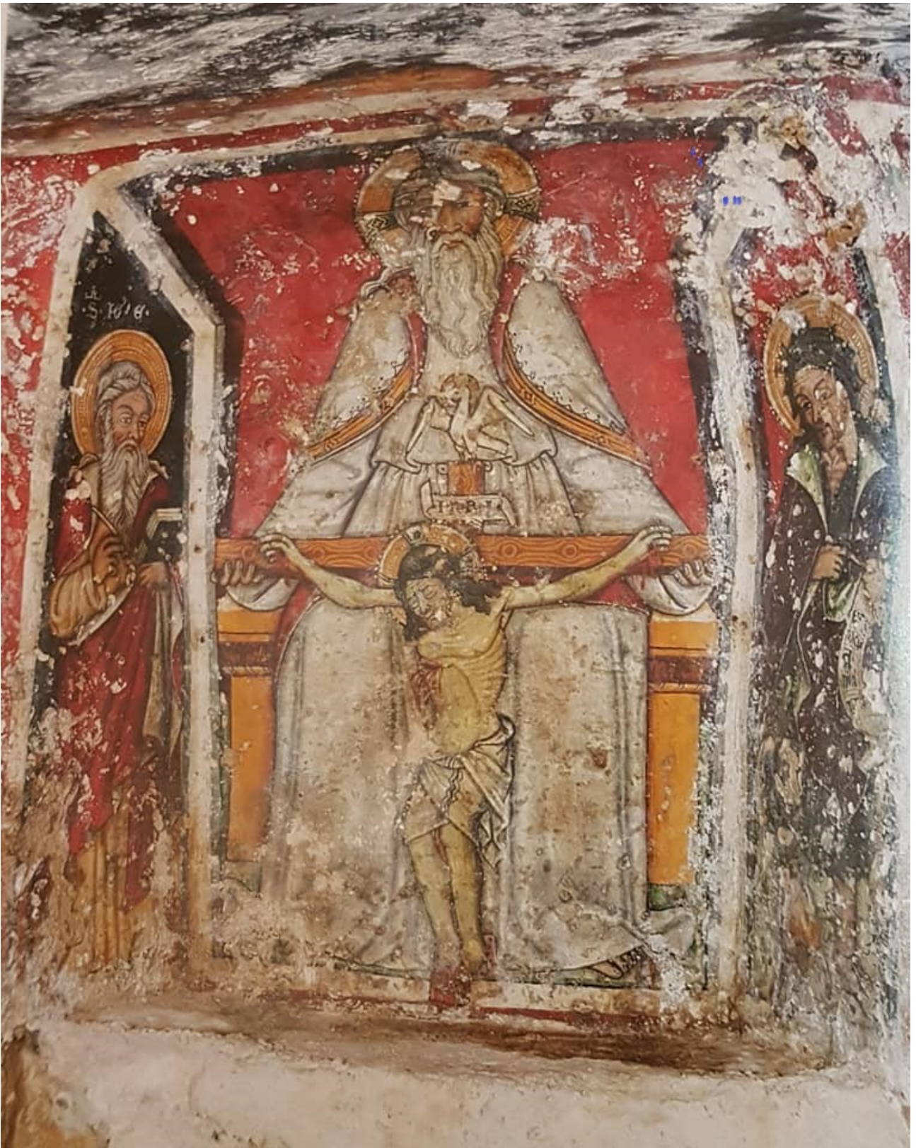
Veglie – Cripta della Favara