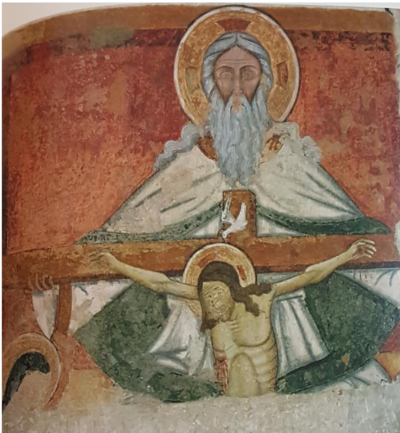
Otranto - Cattedrale